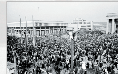
Pirmosios Lietuvos nepriklausomybės atkūrimo – Kovo 11-osios – metinės. Šventė Nepriklausomybės aikštėje prie Lietuvos Respublikos Aukščiausiosios Tarybos rūmų. Vilnius, 1991 m. kovo 10 d. Fotografas Vladas Ščiavinskas (Lietuvos centrinis valstybės archyvas).

1990 m. kovo 11 d. Lietuvos Respublikos Aukščiausioji Taryba aktu „Dėl Lietuvos nepriklausomos valstybės atstatymo“ paskelbė, kad yra atkuriamas „1940 metais svetimoms jėgoms panaikintas Lietuvos Valstybės suverenių galių vykdymas, ir nuo šiol Lietuva yra vėl nepriklausoma valstybė“. Šis Aktas – svarbiausias Lietuvos istorijos dokumentas – po penkiasdešimt metų trukusių Tautos pastangų išlaikyti laisvės dvasią ir sovietų įvykdytos okupacijos ir aneksijos atvertė naują mūsų istorijos puslapį.