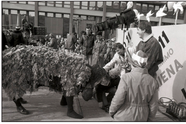
„Keistuolių teatro“ vaidinimas Nepriklausomybės aikštėje prie Lietuvos Respublikos Aukščiausiosios Tarybos rūmų. Vilnius, 1991 m. kovo 10 d.