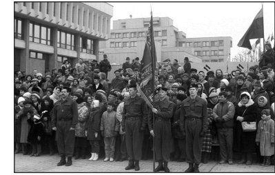
Pirmoji šventinė Lietuvos karių rikiuotė Nepriklausomybės aikštėje.