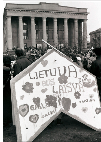
Vaikų linkėjimai Lietuvai. Vilnius, 1991 m. kovo 10 d.

Šioje parodoje eksponuojamos 1991 m. kovo 10–11 dienų fotografijos, įamžinusios pirmąsias nepriklausomos valstybės atkūrimo metines. 1991 m. kovo 10–11 dienų šventės kūrė valstybinių švenčių tradicijas, kurias mes išsaugojome ir puoselėjame iki šių dienų. 1991 metais Lietuva ir jos piliečiai patyrė ne tik Nepriklausomybės atkūrimo šventinius jausmus, bet ir sovietų ekonominę blokadą, karinę prievartą ir agresiją. 1991 m. sausį beginklių Lietuvos žmonių pasiaukojimu ir gyvybėmis Nepriklausomybė buvo apginta. Šie sunkumai ir netektys tik sutvirtino tautos apsisprendimą siekti Nepriklausomybės. 1991 m. vasario 9 d. visuotinės Lietuvos