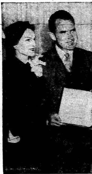
Viceprezidentas R. Nixonas su žmona. Šypojsosi ir akmenim mėtomas.

Amerikos spauda kaltino Caracas policiją, kad ji neparodžiui jekio aktyvumo