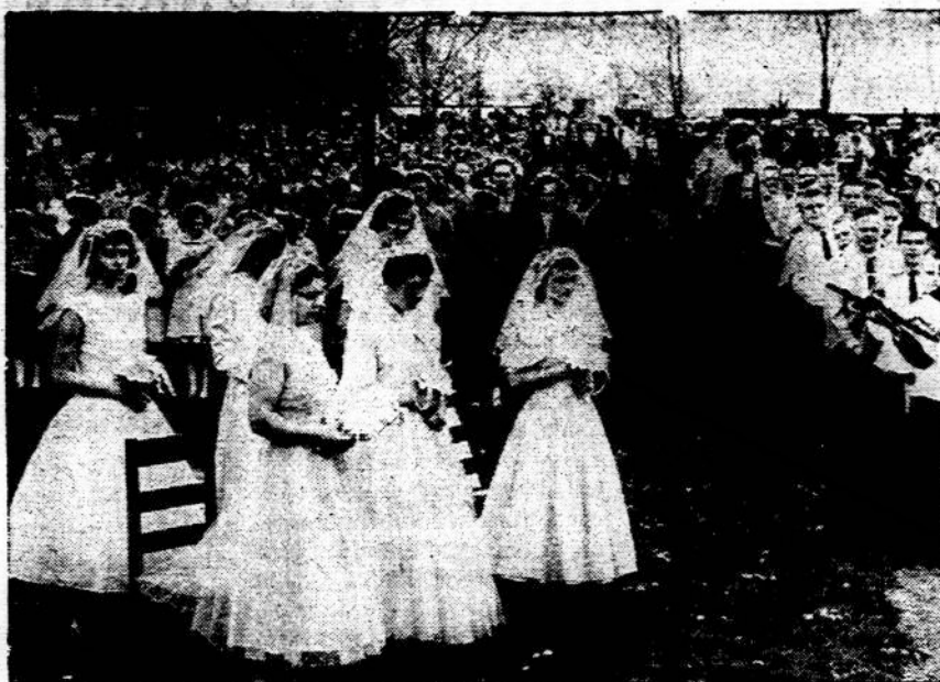
Vaičių gegužinė procesija Brockton, Mass.