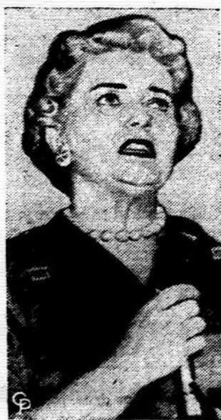
VYRO ULTIMATUMAS ŽMONAI. — Demokratų partijos atstovė JAV kongrese Coya Knutson iš Oklee, Minn., gavė iš savo vyro ultimatinį reikalavimą: pasirinkti kongresą arba namų židinį, nes tos dvi pareigos — atstovės ir žmonos — esą nesuderinamos. Nukentanti seima.