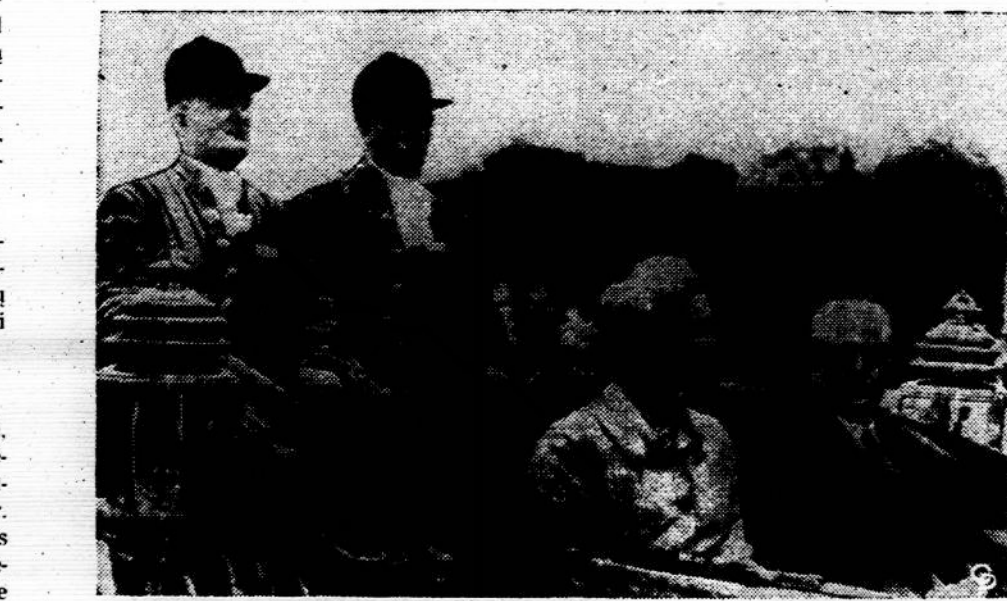
ITALIJOS prezidentas Giovanni Gronchi atvyko į Londoną oficialaus trijų dienų vizito. Tai pirmas toks Italijos vizitas po 34 metų. Prezidentas ir karalienė Elizbeta atviroje kar. etoje.

Lenkijoje, Lotzėje. 68 žydų kapai buvo išniekinti. Kalbama apie sustiprėjusį antisemitizmą. Prieš karą Lenkijoje buvo 3 mil. žydų, dabar 50.000.