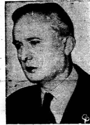
PIERRE PFLIMLIN, naujas 25-tas po karo Prancūzijos ministris pirmininkas.