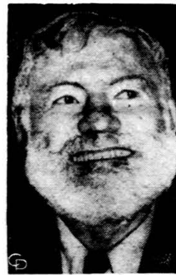
Ernest Hemingway, Nobelio premijos laureatas, turi vargo su išgavimu jam priklausancio honoraro už jo knygų vertimus, išleistus Rusijoje.

3. Jei "A. P." redakcija būtų norėjusi likti korektiška, ji privalejo iš anksto pasiteirauti, kokio požūrio ir apimties bus Korp. Neo-Lithuania suvažiavimas New York'e. Tuo atveju būtų buvę patirta, kad dėl lėšų stokos ar kitų kliūčių iš tolimesnių nuo New York'o vietovių suvažiavime galės dalyvauti tik maža dalis. Taigi, tiek Chicagoje, tiek jai artimesnėse vietovėse rasis dar pakankamai neo-lithuanų, kurie dalyvavo