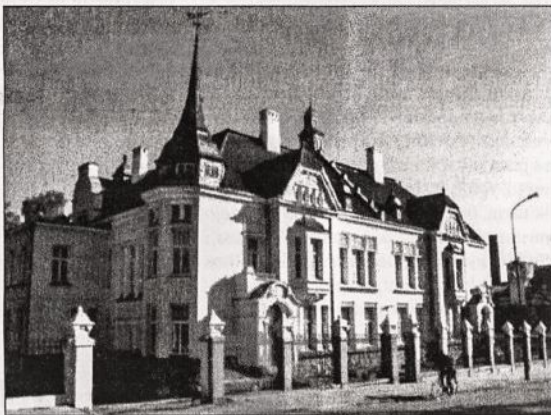
Chaimo Frenkelio vila Šiauliuose.