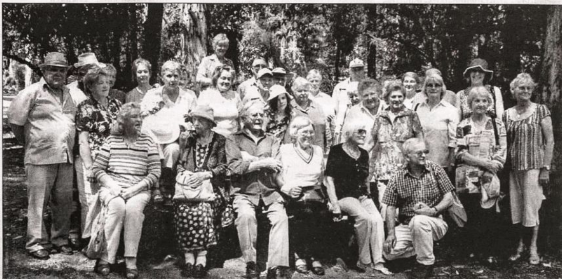
Šių metų lapkričio 10 dieną Melbourno pensininkai dalyvavo išvykoje į Badgers Creek. Plačiau apie išvyką skaitykite "M.P." psl. 3. išvykos dalyviai pasiekę tikslą.